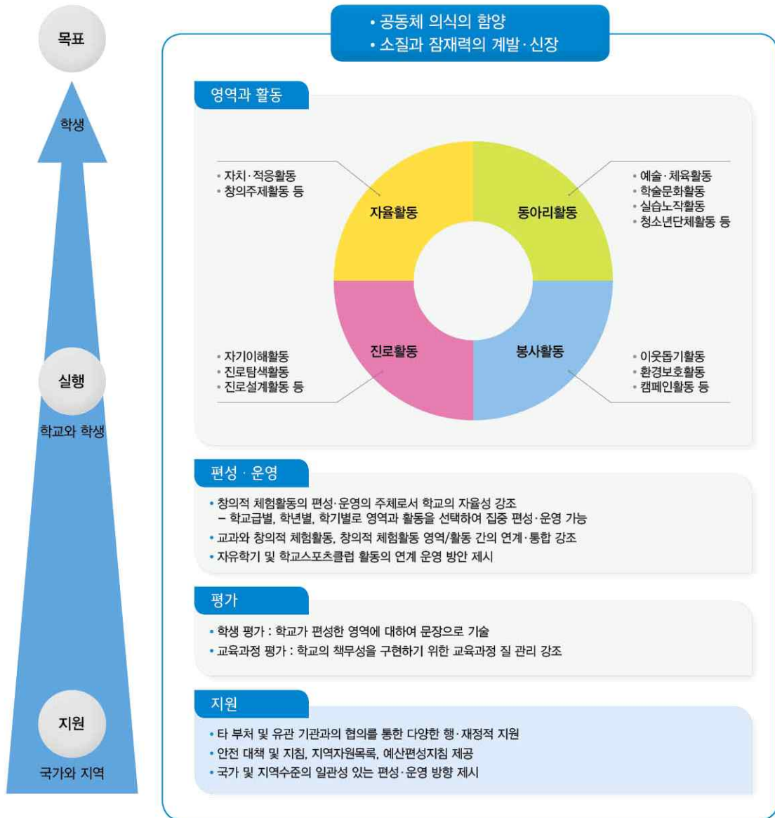
[그림 1] 창의적 체험활동 교육과정의 기본 방향

창의적 체험활동 교육과정의 편성·운영의 주체는 학교이다. 국가 및 지역 수준에서는 학교와 지역의 특색을 고려하여 전문성을 갖춘 인적·물적 자원을 충분히 제공할 수 있는 기반을 마련한다.